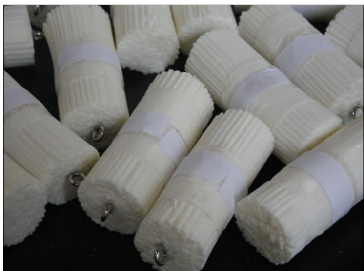
本物そっくりの麺。麺を束ねる帯も付いています

2分の1スケールの「温麺」は、例によって細部に至るまで本物そっくりに作り込んであります。漢字の包装が受けて外国人からも好評です。