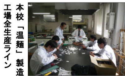
本校「温麺」製造工場全生産ライン

2分の1スケールの「温麺」は、例によって細部に至るまで本物そっくりに作り込んであります。漢字の包装が受けて外国人からも好評です。