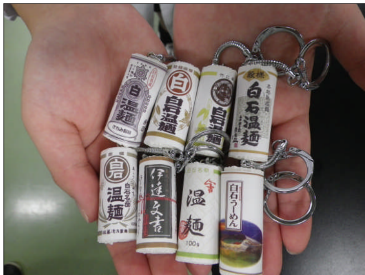
奥州白石温麺協同組合加盟7社様の8商品を忠実に再現

9月27日~28日、栃木県のツインリンクもてぎ(スーパースピードウェイ)で、Hondaエコマイレージチャレンジ2014全国大会が開かれ、本校機械部自動車班から『STH-V』、『STH-VI』の2台が出走し共に完走しました。 このうち STH-VIは、大会直前に完成した新型車。電子制御も搭載し、記録が期待されましたが、調整不足がたたって目標の燃費1000km/lの達成はなりませんでした。 しかし、設計図を引くところから始め、ほぼ全ての部分を手作りし、組み合わせて完成させた約1年の活動は、部員にとって得難い経験となったようです。